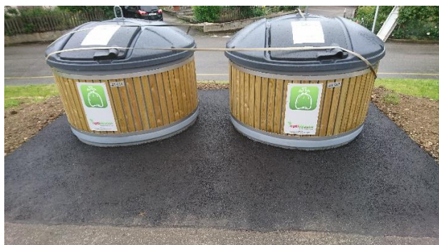
Rue de l'Eglise