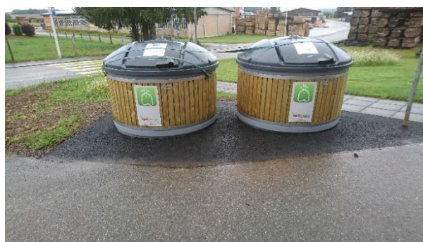
Route de Bonfol

Le dernier ramassage porte à porte des sacs de déchets ménagers aura lieu le jeudi 18 juin 2020. Ensuite, dès cette date , les conteneurs semi-enterrés (moloks) devront être utilisés pour y jeter les sacs taxés. Il n'y aura plus de ramassage porte à porte à Vendlincourt.